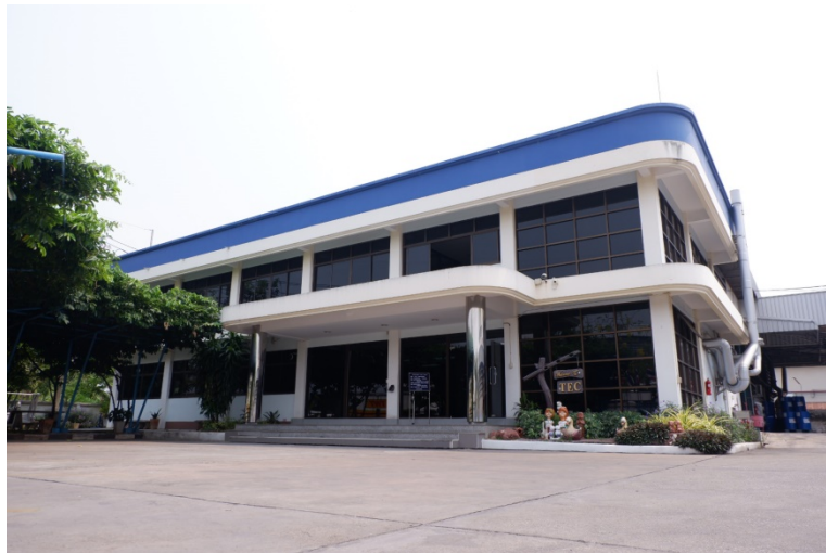
Thai Eurocoat Ltd. 外観